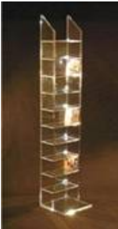
Pleksiglas za bibliotekare, arhivare i muzeologe www.prozirni- namjestaj.hr