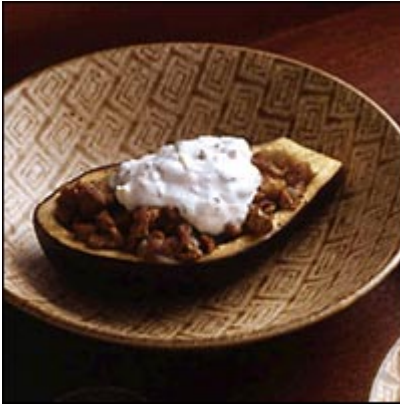
Mongolski Prekrivač od patlidžana