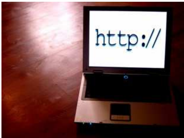
Slika 2 - ... i danas.

Devedesetih godina 20. stoljeća informacijske tehnologije su počele na velika vrata ulaziti u radne prostore knjižnica svih vrsta (od dječjih do specijalnih) i njihovih