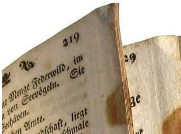
Slika 1 – Izvori informacija nekad...

Još donedavno osnovna je uloga knjižnica bila odabir, prikupljanje, obrada, organiziranje, predstavljanje i pohranjivanje građe. Kako bi došao do informacije, naš je korisnik-Alisa trebao doći u knjižnicu, pretražiti kartični katalog ili razgovarati s knjižničarem-informatorom. Izvori informacija bili su ponajviše tiskane publikacije (knjige i časopisi) koje je valjalo pronaći na policama, posuditi na određeno vrijeme ili proučavati u čitaonicama.